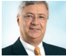
Klaus-Peter Müller Multi-Aufsichtsrat

Neben der Erweiterung des Kreises geeigneter Persönlichkeiten, die künftig Aufsichtsratsmandate wahrnehmen könnten, einer höheren Diversity, gilt es auch grundsätzlich die Qualifikation von Aufsichtsräten zu erhöhen. In diesem Zusammenhang hat sich die Regierungskommission Deutscher Corporate Governance Kodex bewusst für eine Ausweitung von Weiterbildungsmaßnahmen ausgesprochen, die künftigen Kandidatinnen und Kandidaten für Aufsichtsratswahlen sowie schon amtierenden Aufsichtsratsmitgliedern offenstehen.