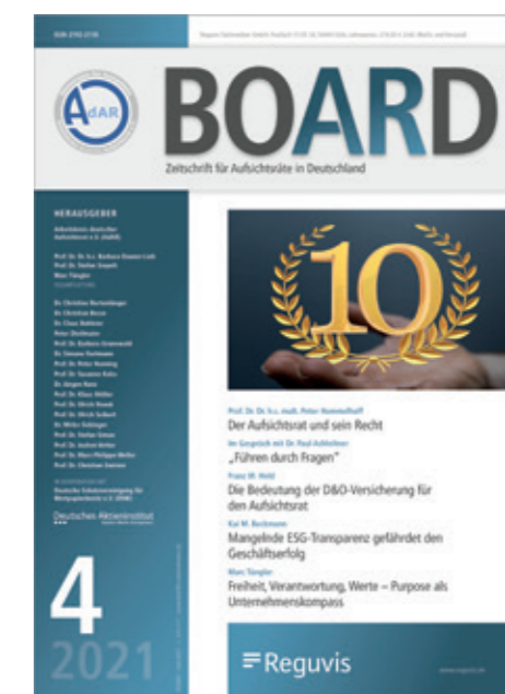
BOARD – Zeitschrift für Aufsichtsräte

Mit unseren Fachausschüssen legen wir den Fokus auf aktuelle und wichtige Aufsichtsratsthemen wie die Digitalisierung oder die Prüfpflicht des CSR-Berichts seitens des Aufsichtsrats. Auch Themen wie Haftung, D&O-Versicherung oder spezifische Belange von Aufsichtsräten aus dem Mittelstand und aus öffentlichen Unternehmen sind Gegenstand der Fachausschüsse. Ob dauerhaft oder ad hoc eingerichtet, erfahrene Experten aus der Aufsichtspraxis und der Wissenschaft informieren Sie bedarfsgerecht aus erster Hand über Entwicklungen und Konsequenzen für den Aufsichtsrat. Die Mitglieder unserer Fachausschüsse setzen sich zudem für eine professionelle Aufsichtsratsarbeit auch auf politischer Ebene ein.